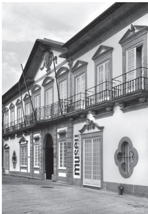
Fig. 3. Fachada do Museu Municipal de Penafiel, instalado no palacete setecentista dos Pereira do Lago, em pleno centro histórico. Projecto de requalificação dos arquitectos Fernando Távora e José Bernardo Távora, inaugurado a 24 de Março de 2009. (MMPNF: Fot. Manuel Ribeiro, 2009).

expressão comum até meados do século XX. Manteve-se um espaço para mostras temporárias que retractam problemáticas específicas trabalhadas pelo Museu (p.e. bailes do Corpo de Deus 2012, cultivo do milho 2014 ou indústria do alumínio 2015), criando-se abertura para acolher iniciativas externas que diversificam públicos e parcerias, por exemplo nos domínios das artes plásticas, performativas, literárias e musicais, e até do desporto e lazer, enquanto casa que convida, acolhe e permite uma fruição pluralista, a exemplo da Escritaria ou do apoio ao teatro amador Em cena no Museu .