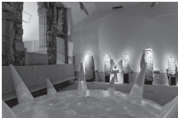
Fig. 4. Sala do Território, na exposição permanente, com museografia de Francisco Providência. Retrata o território penafidelense nas mais diversas vertentes (geográfica, administrativa, histórica, monumental, turística, gastronómica) com recurso às novas tecnologias interactivas.

tâneo, fixou-se para a posterioridade, em partitura e registo sonoro, a componente musical, edição em parceria 18 .