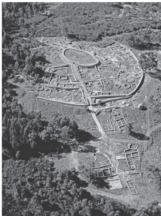
Fig. 2. Castro de Monte Mozinho (Oldrões/ Galegos, Penafiel). O sítio arqueológico após as escavações FLUP/MMPNF (1974-98) e os trabalhos de preservação e valorização executados em 1998. (MMPNF: Fot. PENAGULÃO & BURNAY, 1998).

sob a coordenação de Teresa Pires de Carvalho, e inaugurada em 2004. Marcamos o primeiro destes momentos com a exposição e painel de estudos internacional Monte Mozinho: 25 anos de trabalhos arqueológicos , homenagem a C.A. Ferreira de Almeida, e o segundo com o colóquio Castro, um lugar para habitar , ambos com actas nos Cadernos do Museu (1998 e 2005).